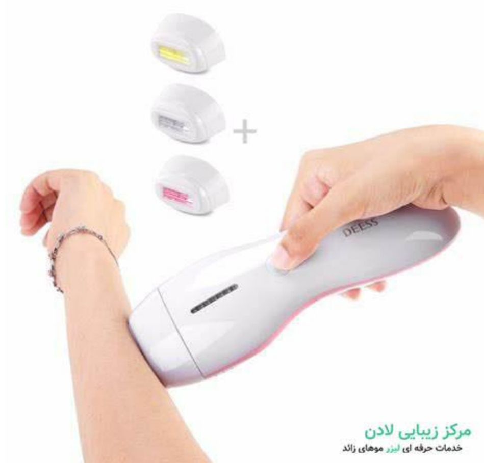
لیزر موهای زائد خانگی

اگر تصمیم به استفاده از دستگاه لیزر موهای زائد خانگی دارید ، دستورالعمل های موجود در مورد دستگاه را دنبال کنید تا در کاهش خطر صدمات به خصوص آسیب دیدگی به چشم کمک کند.