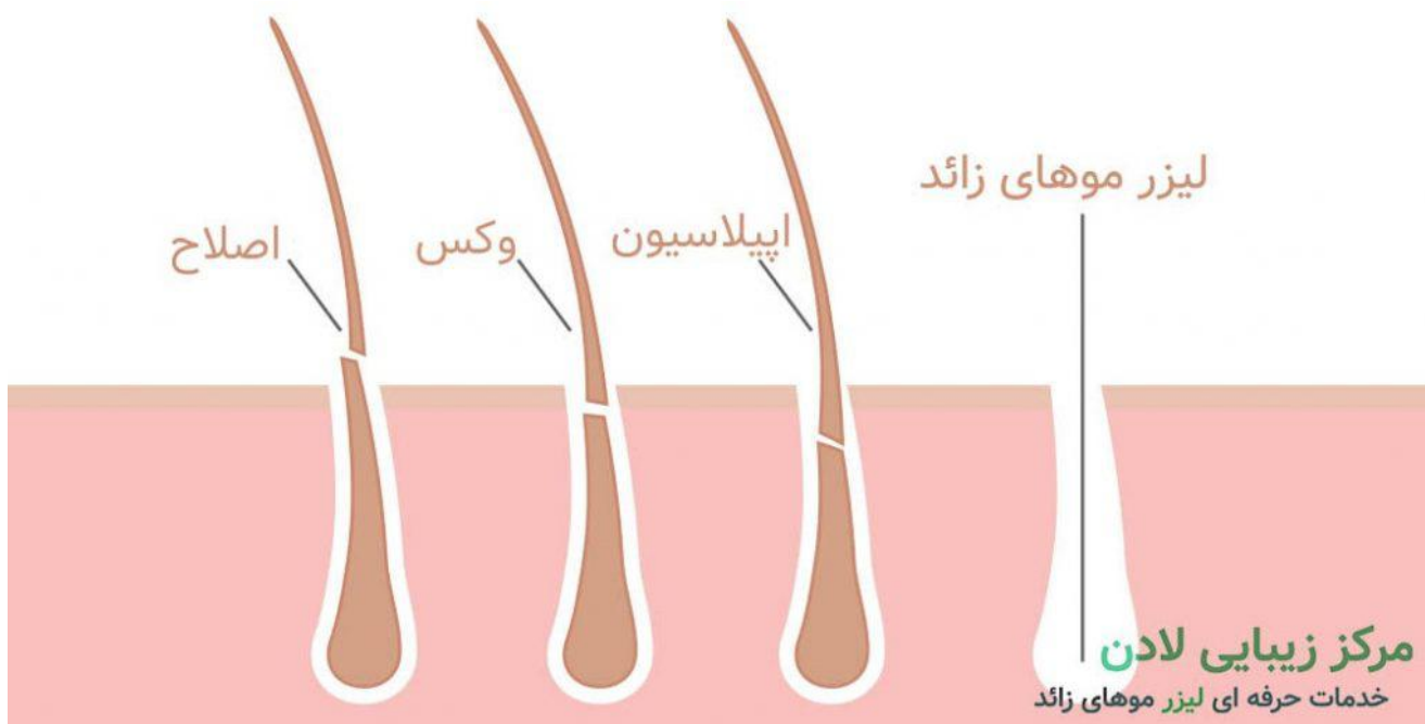
لیزر در مقایسه با سایر روش های رفع موهای زائد