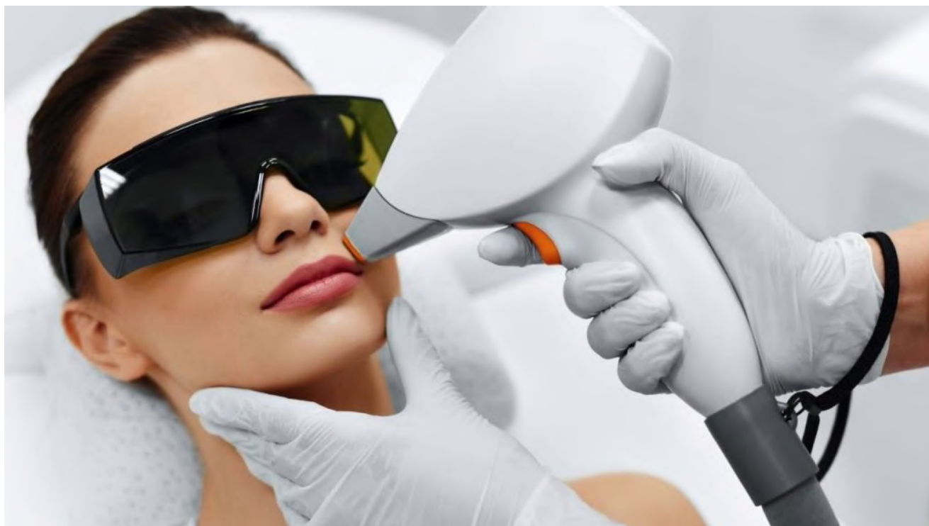
لیزر موهای زائد صورت

در مرحله دوم ، شما می‌توانید موهای خود را با تراشیدن یا استفاده از کرم موهای زائد در تمام طول دوره درمانی خود با لیزر از بین ببرید. موهای شما مانند انجام روش‌های اپیلاسیون ، یا اصلاح مجدداً رشد نمی‌کند. شما می‌توانید برای همیشه از شر موهای زائد خود خلاص شوید.