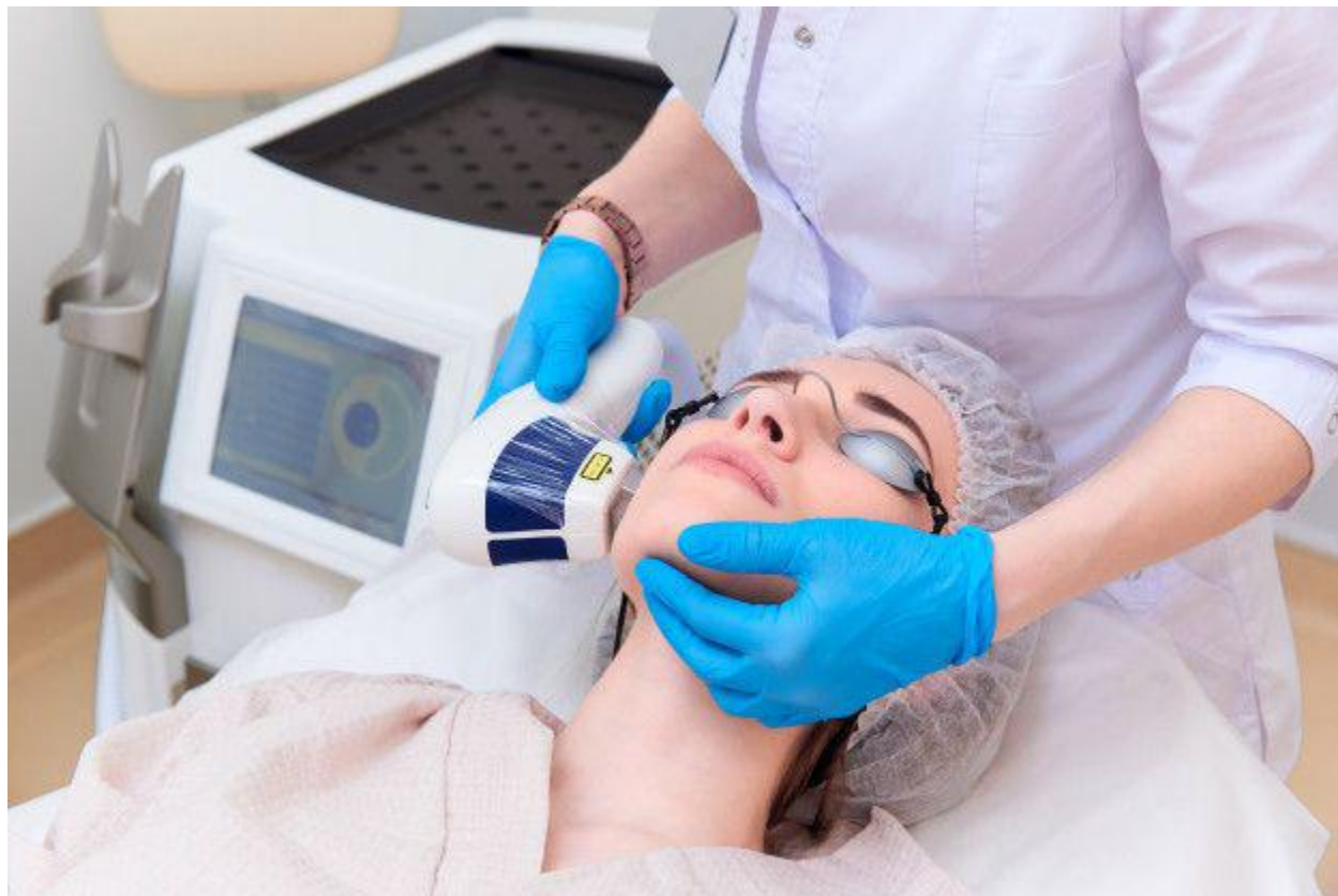
لیزر موهای زائد صورت

اصلاح مو قبل از لیزر موهای زائد صورت واجب است زیرا باعث حذف شدن موها از روی صورت می شود. اصلاح مو قبل از شروع فرایند لیزر توصیه می شود زیرا صورت شما را برای لیزر آماده می کند. اگر مویی در ناحیه تحت درمان وجود نداشته باشد ، فولیکول ها به راحتی دیده می شوند و لیزر به راحتی به آنها دسترسی دارد.