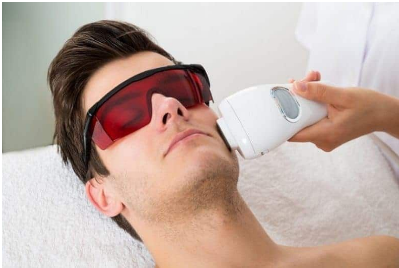
لیزر موهای زائد صورت آقایان

لیزر موهای زائد به اندازه کافی دقیق است تا پوست صورت شما را به حدی از نرمی و صافی برساند و به شما در از بین بردن ناخالصی های صورت کمک می کند. مناطق تحت معالجه شایع لیزر صورت در خاتمه لیزر لب بالا ، لیزر گونه ها ، لیزر چانه ها و ناحیه های جانبی در حالی که مناطق تحت معالجه لیزر موهای زائد صورت در آقایان گردنبنند ، ریش و لیزر پشت گردن هستند. شما می توانید بدون در نظر گرفتن جنسیت ، از لیزر موهای زائد استفاده کنید.