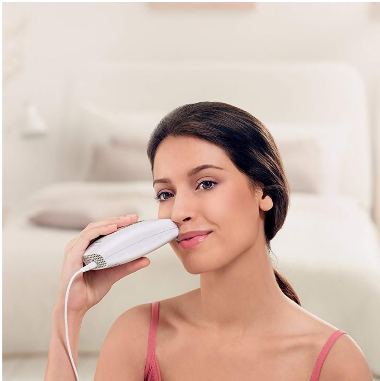
لیزر صورت در خانه

با پیشرفت تکنولوژی، لیزرهایی در بازار موجود است که می‌توانید آنها را خریداری کنید و می‌توانید به راحتی در خانه از آنها استفاده کنید. استفاده آنها آسان است اما اثر آنها نمی‌تواند مانند لیزرهای حرفه‌ای یا تجاری باشد که توسط متخصصین پوست استفاده می‌شود. لیزر در منزل مفید است. این دستگاه‌ها هرگز تأثیر دستگاه‌های حرفه‌ای را نداشته و همچنین ممکن است برخی از عوارض لیزر موهای زائد صورت را برای پوست شما به همراه داشته باشد. همچنین بانوان باردار نیز هرگز نباید بدون مشاوره متخصص پوست از لیزر استفاده کنند، لیزر موهای زائد صورت در بارداری ممکن است پرخطر باشد.